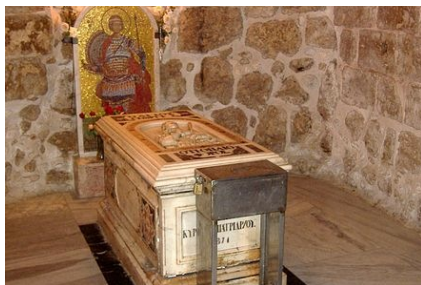
Hrobka sv. Juraja